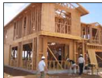
ハワイ州の建築現場

しかし、現在わが国では農薬系がそのほとんどを占めています。いろいろありますが、徐々にほう素系 1 本になっていくのではないのでしょうか。